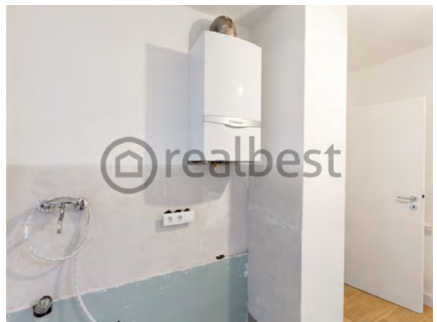
Anschlüsse für Küche